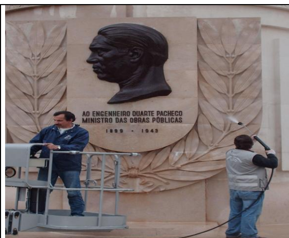
Aplicar uma nova camada de Euro Guardian Graffiti Shield para renovar a protecção.