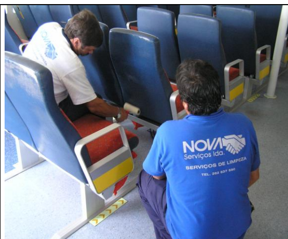
Lavar e neutralizar com água. Secar com um pano.